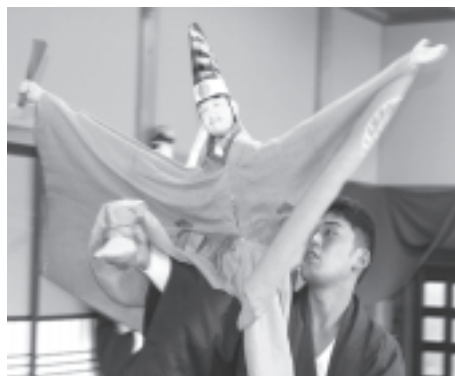
写真7 親沢人形三番叟

偃齒首・偃齒棒式は、最も古い初期段階のうなづき形式である。「うなづき」の本来の意味は初期段階のうなづき形式が物語るように思う。偃齒首・偃齒棒式 えんばかしら のうなづき動作は顔が上を向くものである。よって単にYES・NOの意思表示や写実的表現のためとは考えにくく、何らかの宗教表現ではないかと予想される。顔を上に向ける事例は少数ではあるが、他の民俗芸能にもある。静岡県で行われている「おこ