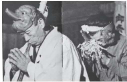
静岡県引佐郡引佐町寺野観音堂「寺野のおこない」翁ともどき(写真10左)火王ともどき(写真11右) 後藤淑・萩原秀三郎『古能』(河出書房新社,1970年)より引用