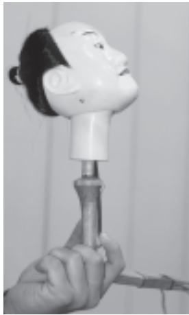
写真9 顔を上に向けるうなづき (優歯首・優歯棒式)

ない」という行事では、翁の曲の時、翁の面を頭の上に乗せて天にむけ、祭文を読むという例である（写真10）。これは一種の宗教表現であるとの考え方もあることから、同じように顔を天に向ける「うなづき」の初期形式も、何らかの宗教表現ではないかとも考えられる。「うなづき」元来信仰から発し、宗教的な意味を持っていたのではないだろうか。